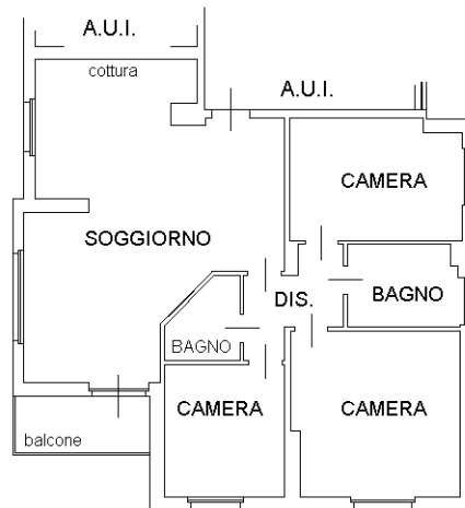
PIANO PRIMO H. 2,95